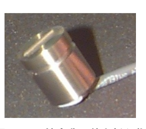
图 1 GDS 钛弯曲元件和插入物