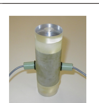
图 5 固定在试样上的弯曲元件

水平弯曲元可以很容易地通过特制的橡胶索环安装在 试样上(见图5)。安装过程需要在橡胶膜上钻一个孔, 然后通过一个O形圈密封。